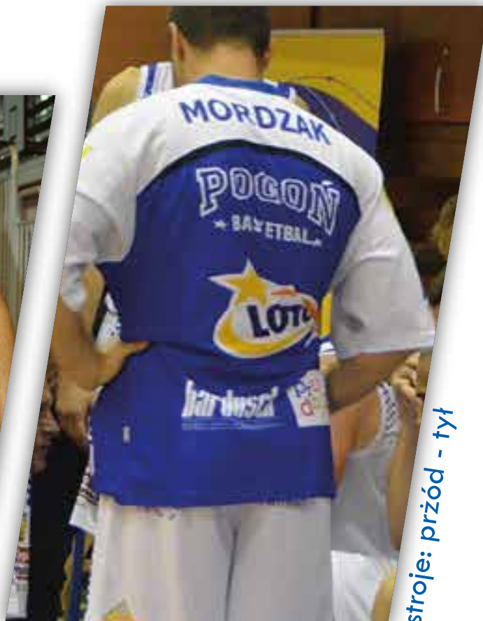
stroje: przód - tył